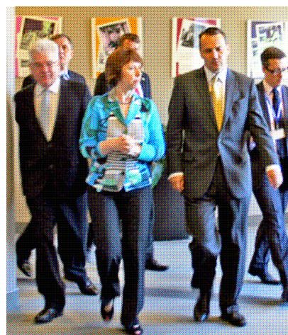
Photo de gauche à droite : Jacek Czaputowicz, Catherine Ashton, Radosław Sikorski

M. Radosław Sikorski, ministre polonais des Affaires étrangères et Mme Catherine Ashton, haute représentante de l'Union pour les Affaires étrangères et la politique de Sécurité, ont profité de