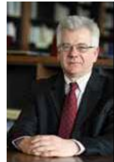
Prof. Jacek Czaputowicz, Directeur de la KSAP

La KSAP, l'Ecole Nationale d'Administration publique polonaise est une institution qui a pour principale mission de soutenir activement les efforts de modernisation de l'administration polonaise par le biais de : la formation initiale et continue, projets de recherche analytique, la coopération avec les institutions d'autres pays.